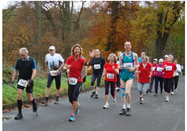
Walker in Aktion

Mit großem Enthusiasmus gingen die Athleten/-innen auf die vorbildlich präparierte Strecke und wurden dabei von vielen Zuschauern in ihrem Kampf um eine gute Platzierung oder die persönliche Bestzeit heftig angefeuert. Im Zieleinlaufkanal kam es z.T. zu packenden Zweikämpfen auf den letzten Metern.