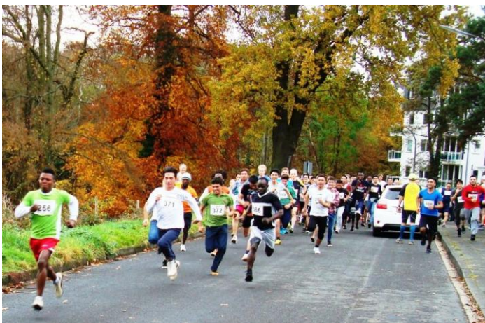
5,9 km Volldampf

Mit großem Enthusiasmus gingen die Athleten/-innen auf die vorbildlich präparierte Strecke und wurden dabei von vielen Zuschauern in ihrem Kampf um eine gute Platzierung oder die persönliche Bestzeit heftig angefeuert. Im Zieleinlaufkanal kam es z.T. zu packenden Zweikämpfen auf den letzten Metern.