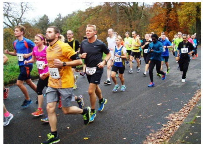
15 km wir kommen

Die jeweils ersten über die verschieden Distanzen waren: